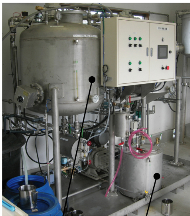
水洗・減圧 脱水タンク