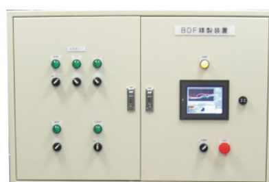
タッチパネル付き制御盤