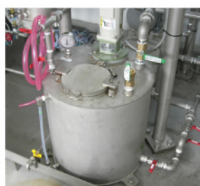
密閉式メタノールミキサー