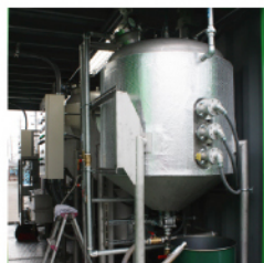
両面にドアを設置 メタノールやグリセリン の出し入れが容易