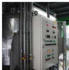
反応・精製用制御盤