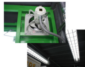
オプション 防爆照明・換気扇

新造 20ft 背高コンテナを JIS 規格鋼材で製作することにより、 建築確認申請を行うことができます。