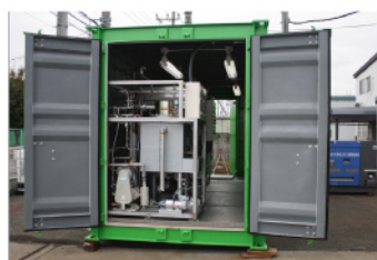
メンテナンスの必要な蒸留機を扉付近に配置