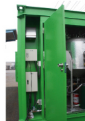
配電盤は外部に 設置